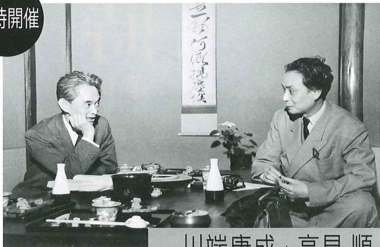
川端康成と高見順

作家は常に出発が到達であり、一つの到達が一つの出発であらねばならぬが、高見が死を前にした、終りの到達ほど、新たな出発を孕んだ到達は、稀であった。