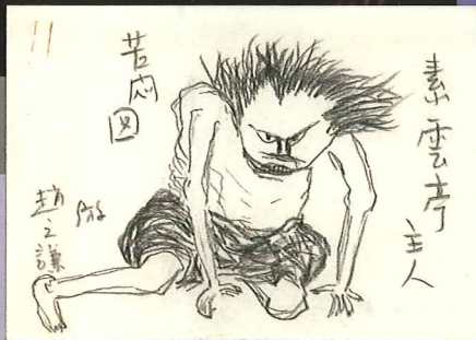
左：昭和20年の日記より「われは草なり」 右：スケッチ「素雲亭主人苦悶図」